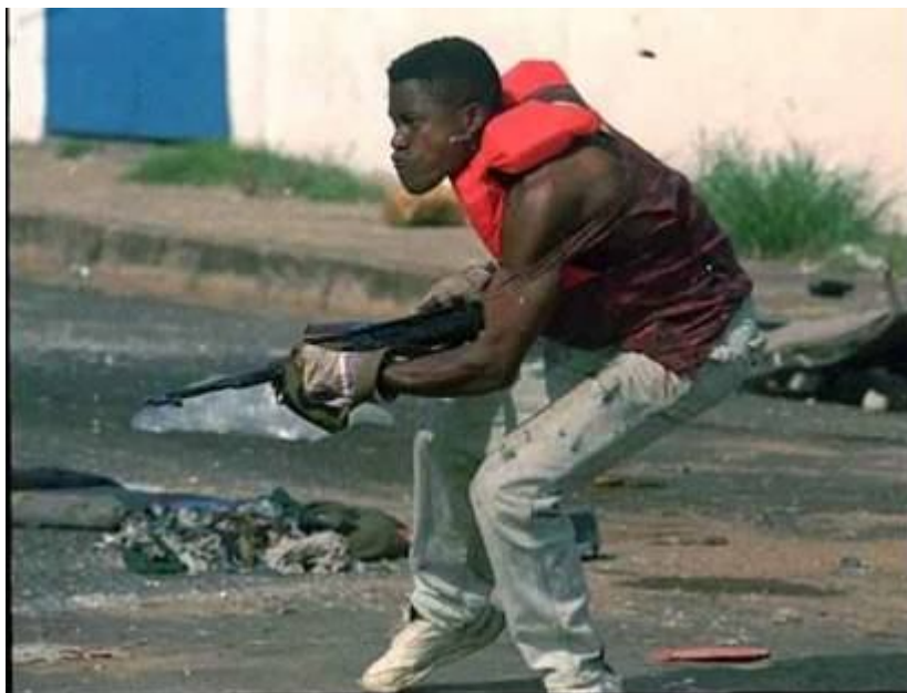
Фото 10 - '..Теперь я ору, что он сам КАЗзззЁЛ, а ты стреляешь ...': разделение обязанностей.

Фото 9 - Можно заметить как серьезно относятся в Либерии к спасению на водах. Этот стильный спасательный жилет не только украшает, но и спасет при случайном падении с моста. От пуль (к сожалению) не спасает, но при такой точности стрельбы это (к счастью) и не актуально. А в строительных рукавицах не горячо держать оружие.