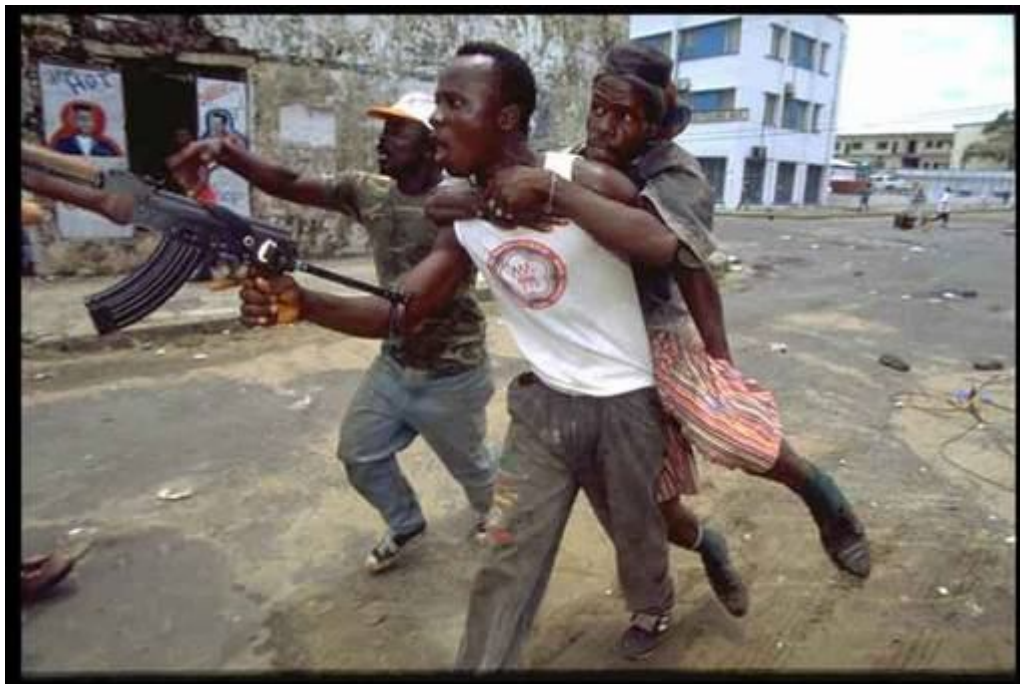
Фото 5 - Стрельба с упором в бедро. Главное здесь - переорать автомат. Тогда испуганный противник какается и убегает. На заднем плане - стрелок копает автоматом касаву.