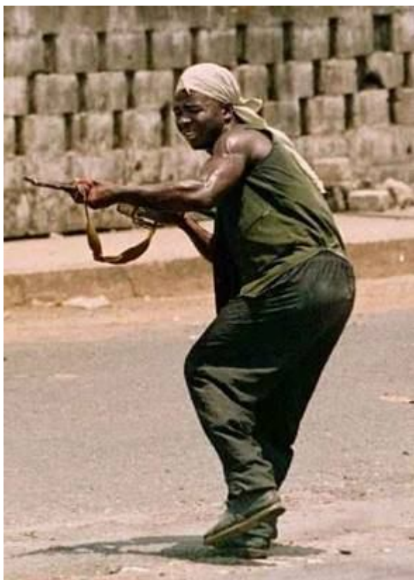
Фото 3 - Yo-yo-yo-SHIZZLE : подсказывать уже не надо, да? Ну, про глаза? Балансируя на одной ноге прицельный огонь вести неописуемо легче - это знают все.

Далее - менее известные, но не менее популярные стили