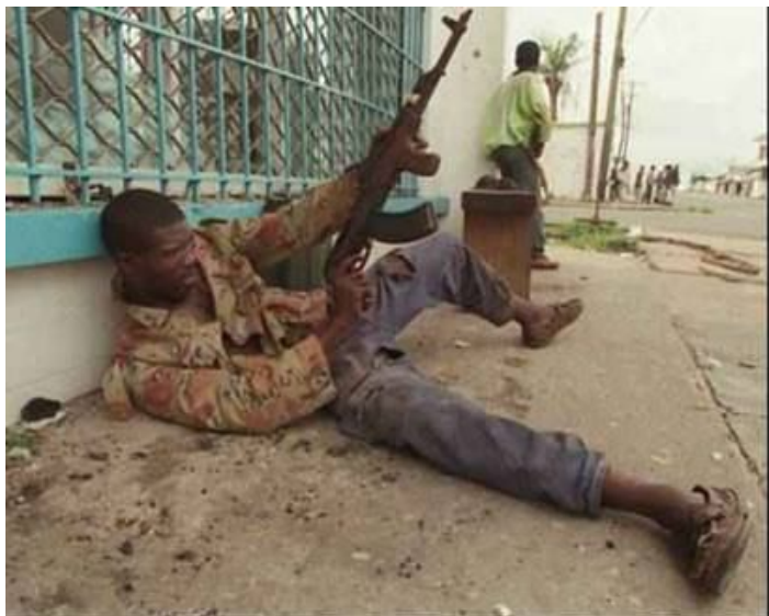
Фото 7 - О-о-о-о !!! Здесь у нас Классика! Стрельба из положения лежа. Жаль только пружина вывалилась из магазина...но разве такая мелочь может остановить настоящего стрелка ?!

Фото 6 - Стиль "бездомный мальчик" - прекрасно помогает при противовоздушной обороне и отличается повышенной точностью.